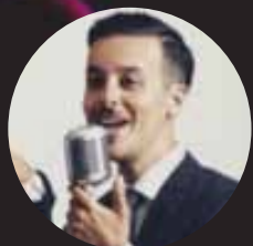
AVENUE LOUNGE BAND