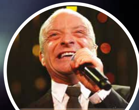
JONAS GARDELL OM UTANFÖRSKAP OCH SJÄLVFÖRTROENDE