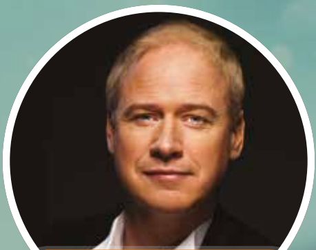
ROBERT GUSTAFSSON TOMGÅNG, FRAMGÅNG, RUNDGÅNG