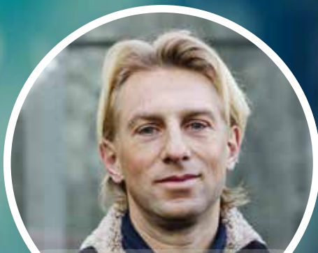
ANDERS HANSEN HJÄRNSTARK - HUR MOTION STÄRKER DIN HJÄRNA