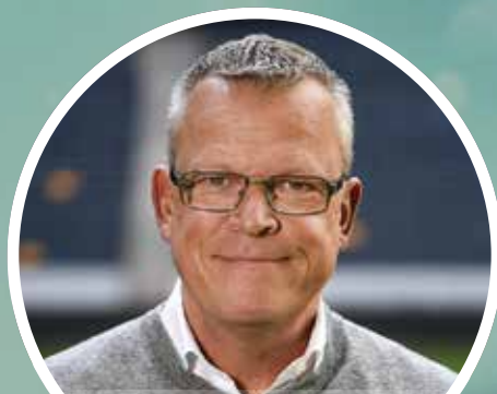
JANNE ANDERSSON BYGGA VINNANDE LAG